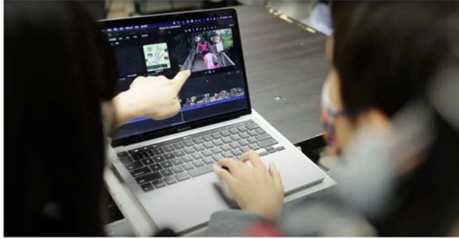
小梓起初只用舊電話拍攝及剪接，後來得到香港中華基督教青年會「愛·實現」基金幫助，有新iPhone及MacBook Pro進行更專業的影片製作。