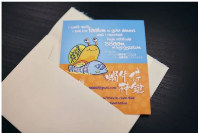
梓鍵自己設計的卡片。