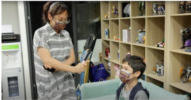
梓鍵媽媽不時充當兒子的攝影師。