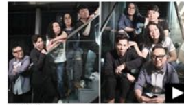
5小時前 獨家唱 | 太極8月驟前為《蘋果》讀者 預演 將悲痛轉成動力唱到老